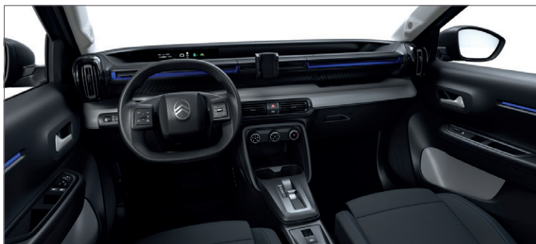
YOU: LÁTKA ČERNÁ FABRIC / ŠEDÁ FABRIC