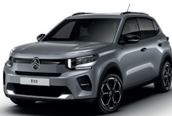
Šedá MERCURY (M)