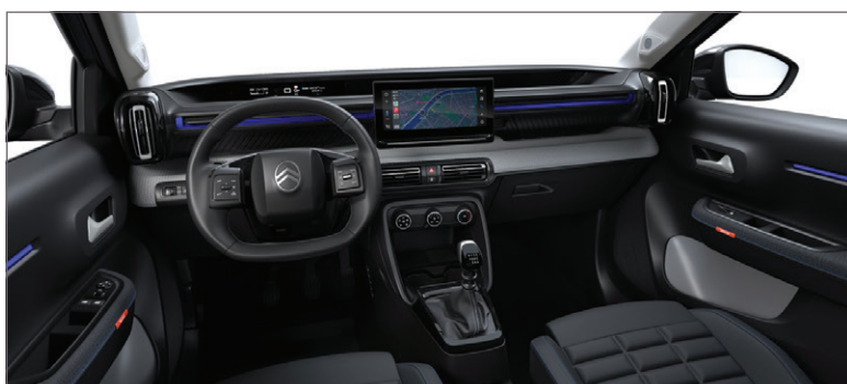
PLUS: LÁTKA ČERNÁ FABRIC / ŠEDÁ SERGE FABRIC