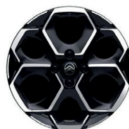
Hliníkový disk ATACAMITE 17" - diamantée