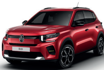
Červená ELIXIR (M)