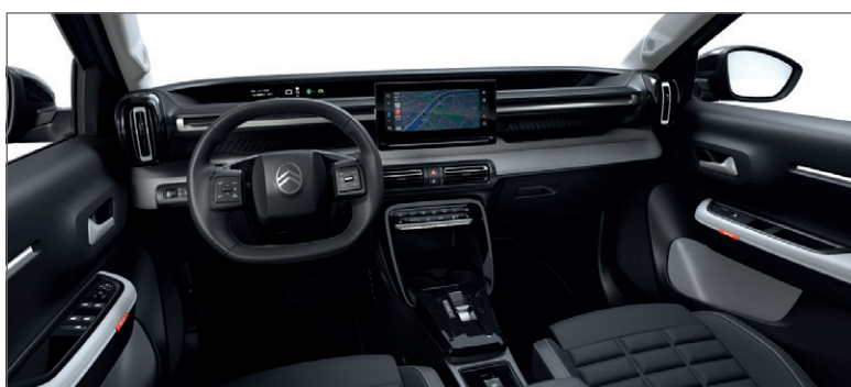
MAX: LÁTKA ČERNÁ FABRIC / ŠEDÁ KOŽENKA