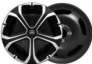
Okrasný kryt TITANITE 16"