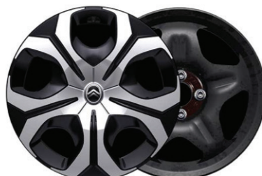
Okrasný kryt SYLVANITE 17"