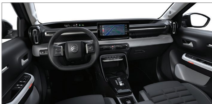
MAX: LÁTKA ČERNÁ HELLO / SVĚTLÉ ŠEDÁ KOŽENKA