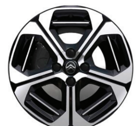
Hliníkový disk ARAGONITE 17" - s výbrusem